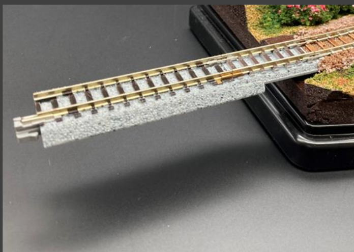
KATO KATO Nゲージ ジョイント 線路 62mm が必要です