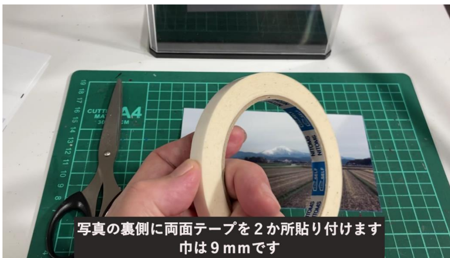
写真の裏側に両面テープを2か所貼り付けます 巾は9mmです