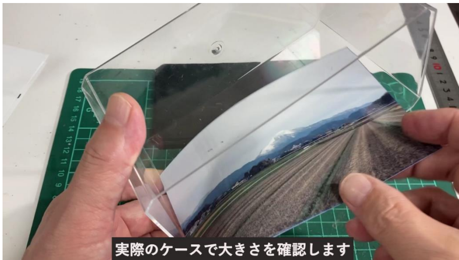
実際のケースで大きさを確認します